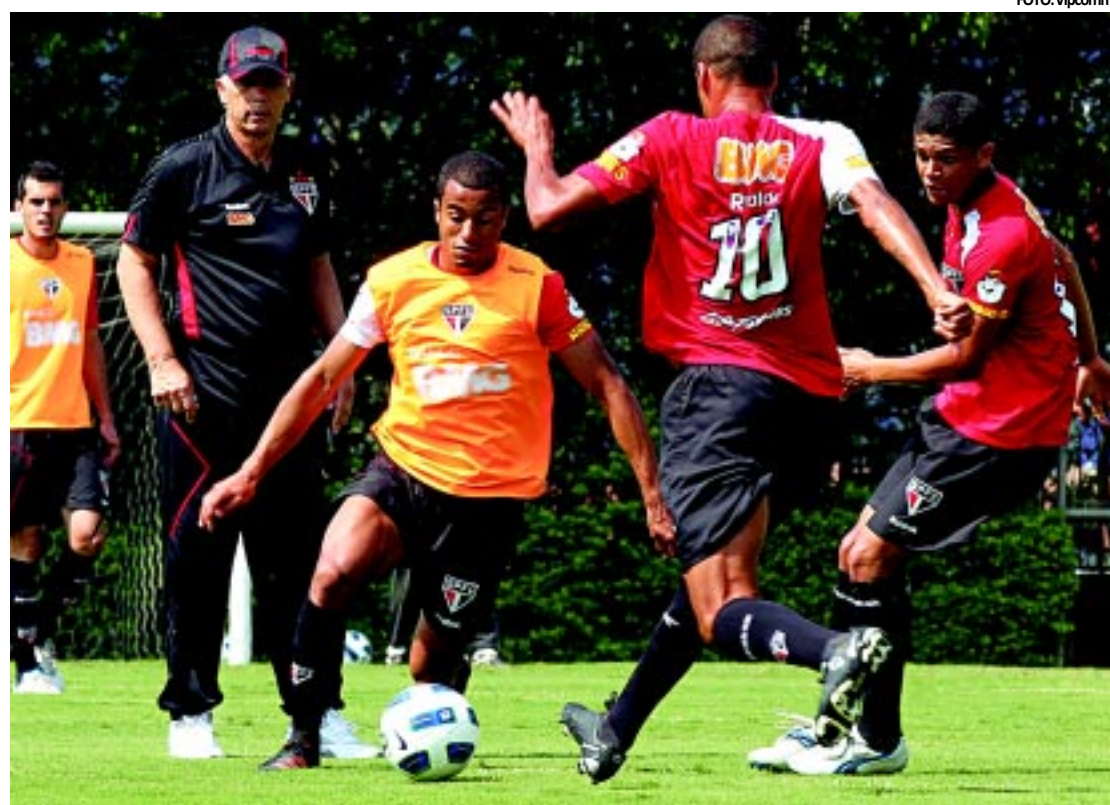
Leão observa atentamente treino do São Paulo que tem um jogo decisivo hoje contra o Avaí pelo Brasileiro