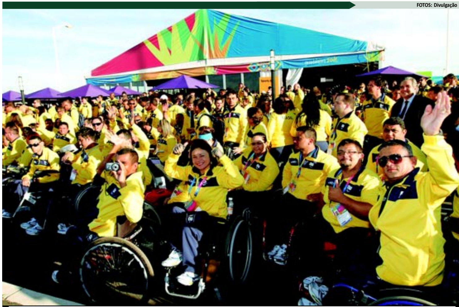
A delegação do Brasil em Guadalajara é composta por 222 atletas e muitos deles vão buscar a vaga para a Paraolimpíada de Londres em 2012

Além disso, na Paraolimpíada de Pequim, o Brasil ficou em nono no quadro de medalhas, com um crescimen-