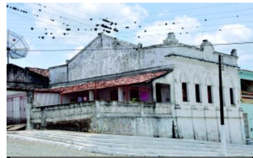
Mesmo as edificações que ainda não foram revitalizadas, guardam beleza singular