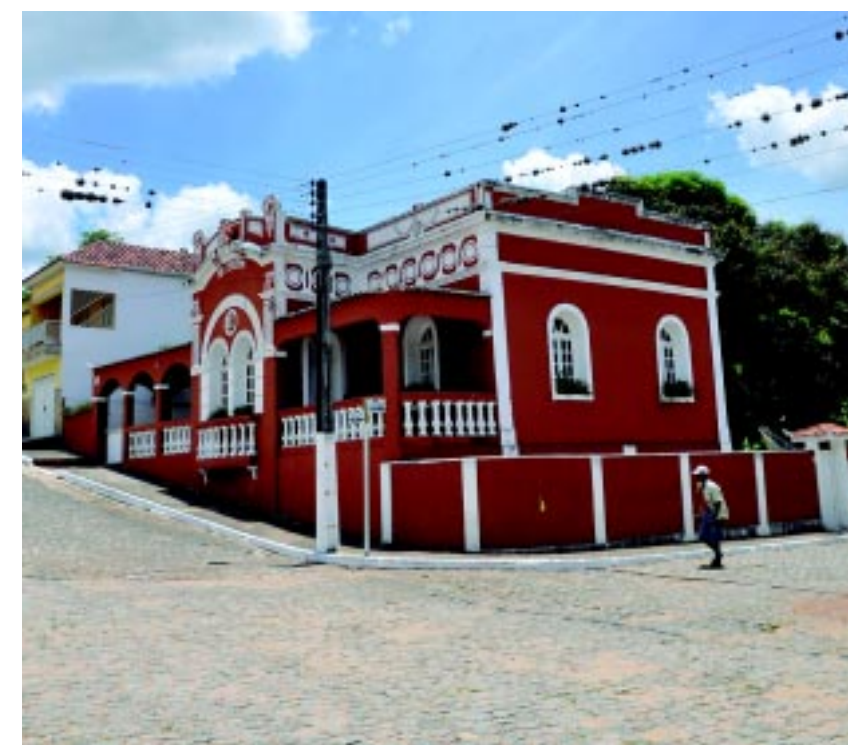
Muitos casarões já foram restaurados e retratam a riqueza dos moradores