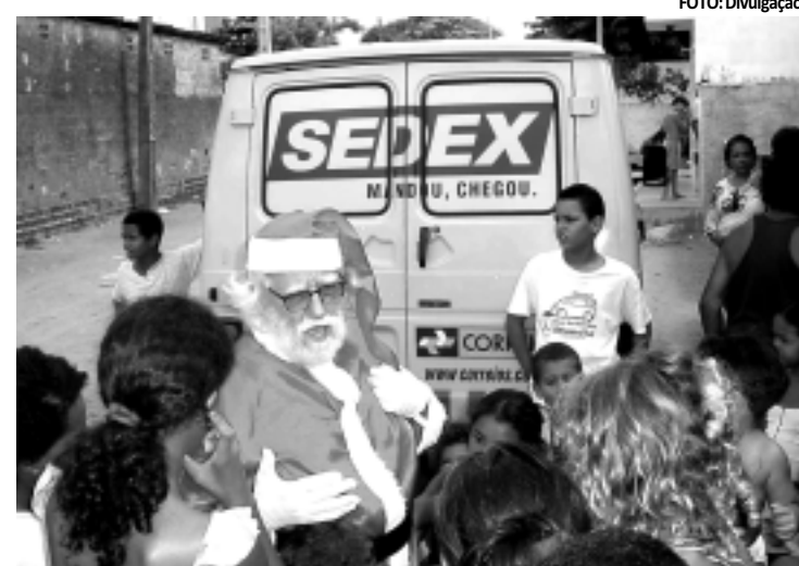
Junto ao Papai Noel da ECT, as pessoas poderão apadrinhar uma cartinha

Em 2010, em todo o País, foram postados 1.239.084 de cartas destinadas ao Papai Noel dos Correios. Desse total, por meio da campanha, foram entregues 685.698 presentes. Na Paraíba, foram recebidas 27.805 cartas, sendo