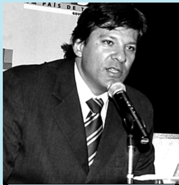
Fernando Haddad disse que haverá uma revolução no ensino médio

parcerias em andamento no Sistema S, que inclui, o Serviço Nacional de Aprendizagem Industrial (Senai) e o Serviço Nacional de Aprendizagem Comercial (Senac), os jovens do Ensino Médio terão mais chances de entender os seus estudos e se tor-