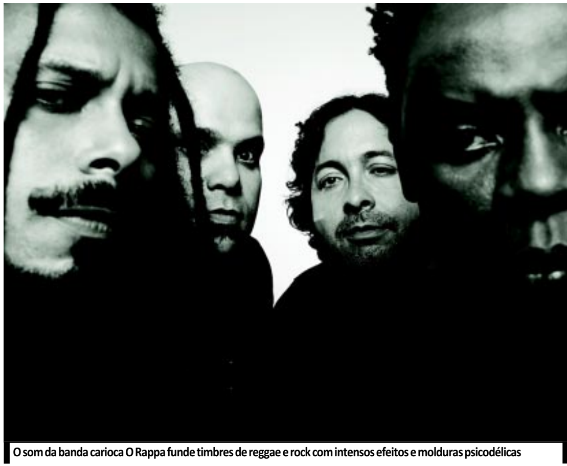
O som da banda carioca O Rappa funde timbres de reggae e rock com intensos efeitos e molduras psicodélicas