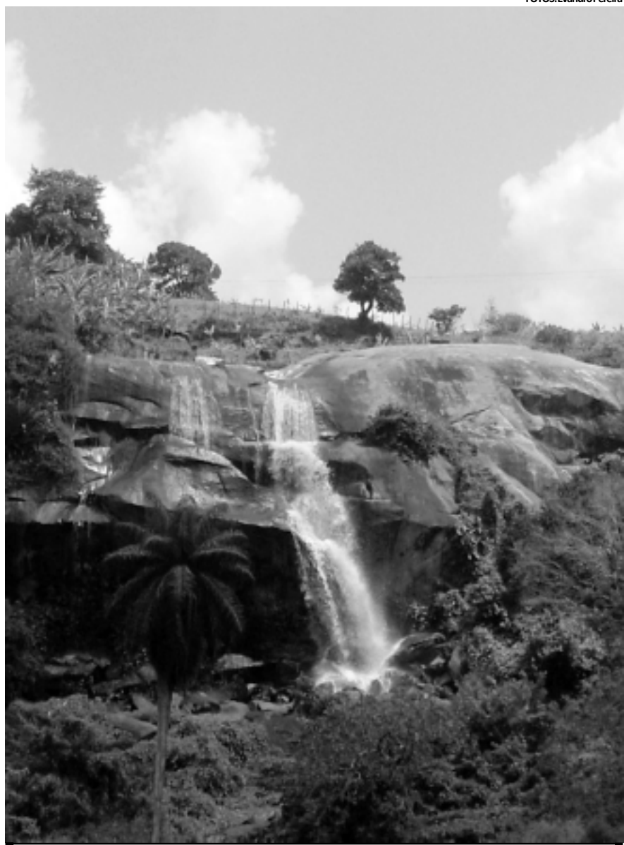
A cachoeira Boa Vista é um atração natural que encanta visitantes e moradores da região