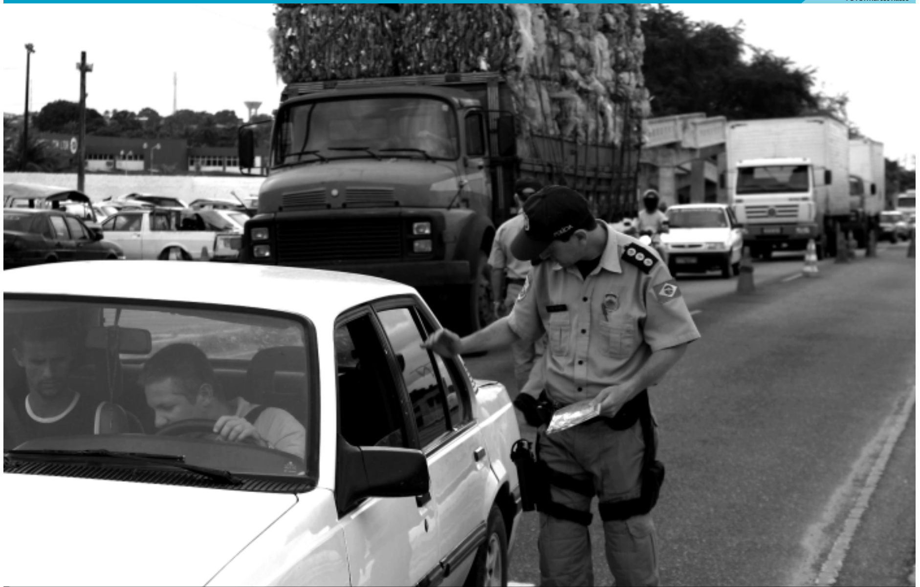
A operação de fiscalização das estradas começa neste final de semana e segue até o feriado do próximo dia 15, quando o tráfego de veículos nas estradas da PB deve aumentar até 20%

A PRF e a PRE alertam às pessoas para que redobrem a atenção nas rodovias em especial neste final de semana e no feriado nacional de 15 de