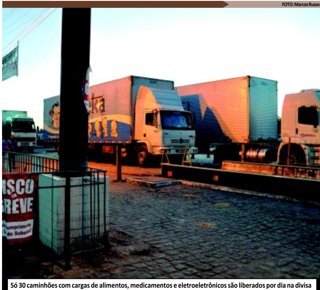
Só 30 caminhões com cargas de alimentos, medicamentos e eletroeletrônicos são liberados por dia na divisa