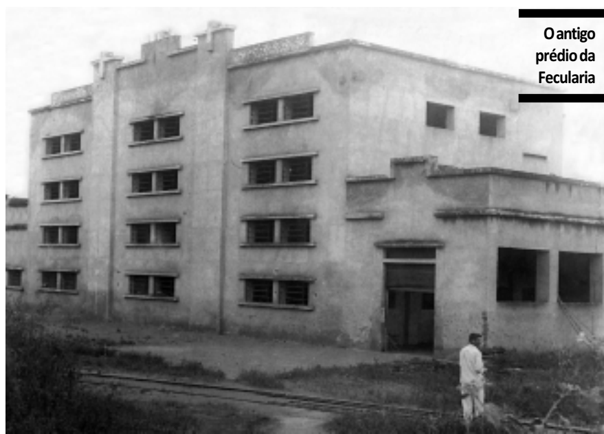
O antigo prédio da Fecularia

Ao longo de sua existência, o município já teve dois outros nomes