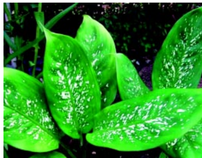
Aninga-pará, a popular comigo-ninguém-pode, causa intoxicação

A informação está presente no site da Fundação Oswaldo Cruz (Fiocruz), onde é possível ter acesso ao Sistema Nacional de Informações Tóxico-Farmacológicas. A Fundação deixa claro que todas as plantas venenosas devem ficar fora do alcance das crianças. Para estipular os limites, é preciso conhecer os vegetais venenosos, identificando-os