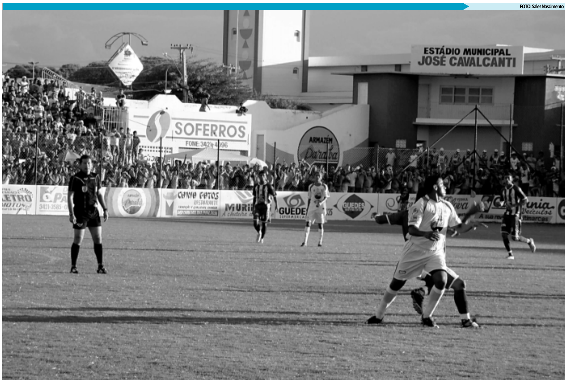
O clássico patoense segue ameaçado de não acontecer em 2012, principalmente depois da renúncia do presidente do Nacional que não vê condições do clube disputar o Estadual

O novo presidente do Nacional terá de administrar vários problemas, entre eles, a dívida com a Federação Paraibana de Futebol. O clube deve perto de R$ 30 mil e se não fizer o pagamento até o dia 30 deste mês estará impedido de registrar atletas para as disputas do Estadual de 2012. Os débitos são da atual temporada e somam-se a ele o recadastramento e o alvará de funcionamento.