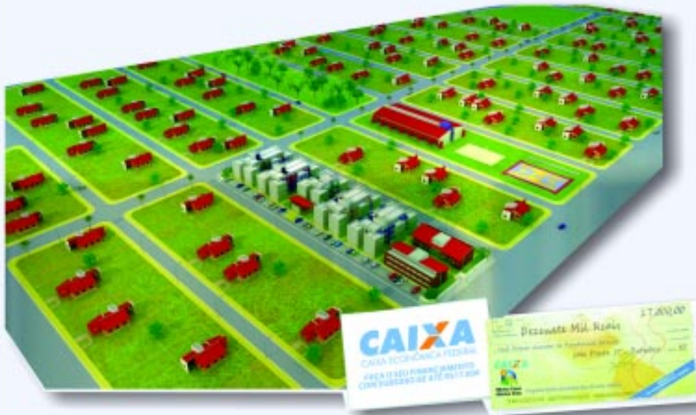
Perspectiva ilustrativa do bloco 01

Venha conhecer sua nova oportunidade para investir ou morar no RESIDENCIAL SOL VILLE. Localizado no loteamento VILA DO SOL, oferece uma ótima infraestrutura com praça, equipamento comunitário, posto policial e uma ampla área verde. É o lugar ideal para você e sua família.