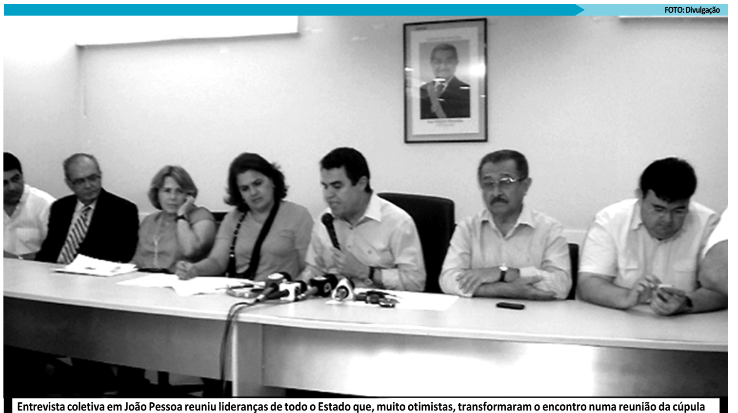
Entrevista coletiva em João Pessoa reuniu lideranças de todo o Estado que, muito otimistas, transformaram o encontro numa reunião da cúpula

Santiago afirmou que não teve acesso garantido aos meios necessários à ampla defesa, num caso em que estava em jogo a perda de seu mandato eletivo. O relator, entretanto, informou que a Mesa do Senado Federal deu a oportunidade para Wilson se manifestar, cumprindo a decisão do STF em que a Corte Suprema afastou a inelegibilidade de Cunha Lima. “O que ele pretendia através da presente writ era impedir o efetivo cumprimento da decisão proferida no Recurso Extraordinário (RE)”, disse o ministro Dias Toffoli.