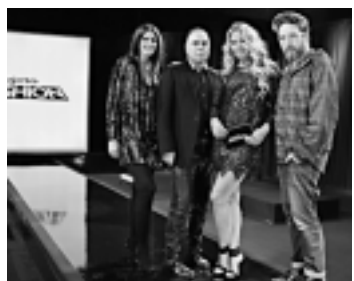
'Projeto Fashion' hoje na Band