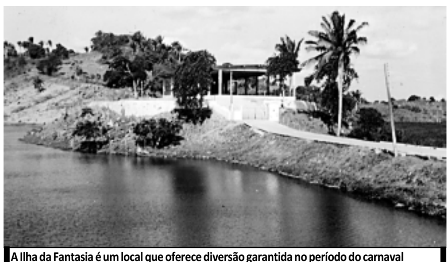
A Ilha da Fantasia é um local que oferece diversão garantida no período do carnaval