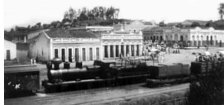
Os antigos engenhos e a extinta linha férrea