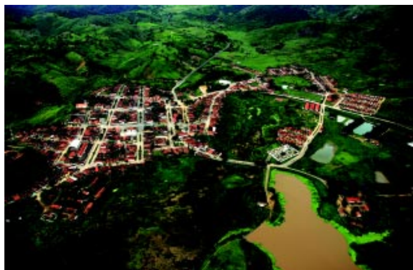
O planejamento das ruas foi feito respeitando o curso do rio Canafístula

O templo é um espetáculo para a vista. Uma casa marron e branca, das proximidades, com pinta de solar português, também chama a atenção dos visitantes, por sua beleza incomum. Foi construída em 1923. Pertenceu ao clã dos Nogueira. Atualmente, encontra-se totalmente restaurada.