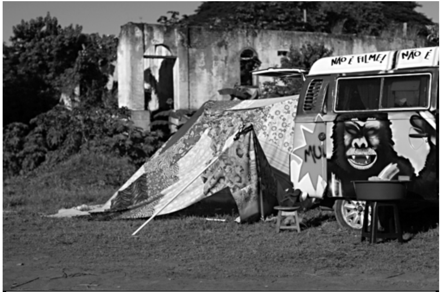
O longa-metragem A Fuga da Mulher Gorila conta a história de duas irmãs que, em uma Kombi, empreendem uma melancólica jornada pelo interior do país