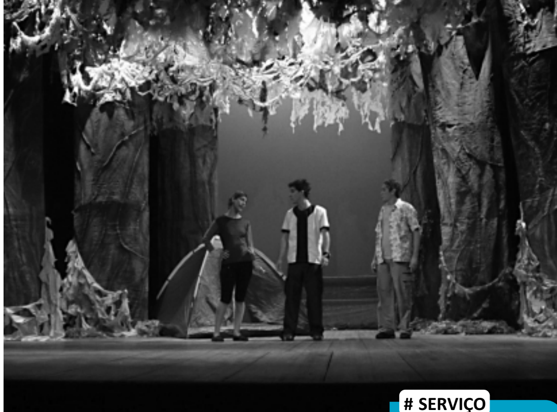
Na peça, Ben Tennysson descobre que pode se transformar em heróis

Ben descobre que, com o Omnitrix, pode se transformar em 10 diferentes heróis alienígenas, cada um com seus próprios poderes. O garoto ainda chega à conclusão de que precisará, também, de todos os po-