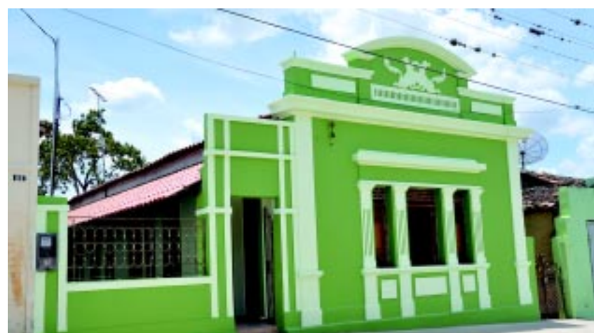
Casarões são uma atração à parte na charmosa cidade do Brejo paraibano

A cidade que foi planejada exibe ruas largas e retas